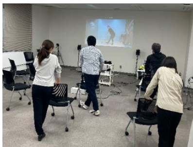
ストレッチセミナーの様子

ストレッチやアイケア、女性の健康セミナー、禁煙セミナー・禁煙チャレンジプログラムなどのオンラインセミナーに加え、新たに、産業保健師による「がん予防セミナー（2023年1月実施）」「花粉症対策セミナー（2023年2月実施）」、ワーク・ライフ・バランスや睡眠についての「衛生講話」の動画配信なども開始し、継続的に実施しています。