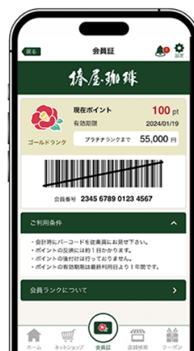
図1 『椿屋珈琲グループアプリ』アイコンと会員証画面