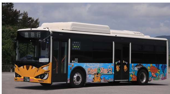
(世界自然遺産ラッピングバス)

西表島交通が運行する路線バスは、世界自然遺産に登録されている西表島の北西部の白浜と東南部の豊原の間を結ぶ路線バスで日本最南端を運行しています。西表島は年間約 30 万人の観光客が来訪する島であり、今般、西表島交通の路線バスが国際ブランドのタッチ決済に対応することにより、カードやスマートフォン等を読み取端末にかざすだけでバスに乗車可能となるため、観光客や地元のお客さまの利便性向上が図られます。