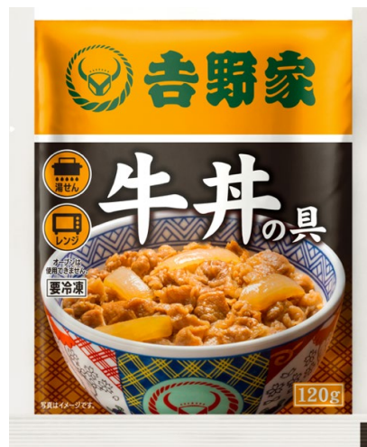
2023年現在のパッケージ