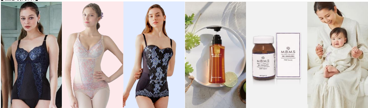
カーヴィシヤス シリーズ