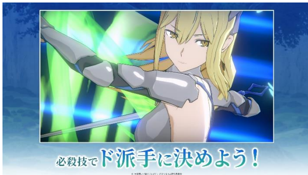
大迫力の 3D で描く必殺技