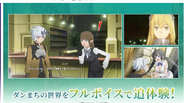
アニメのストーリーを追体験