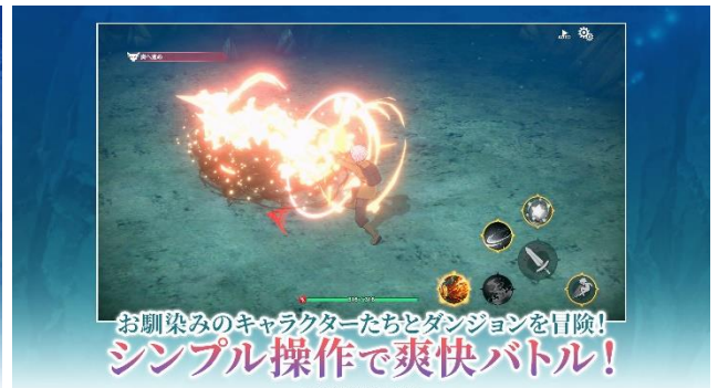
爽快感抜群のバトル