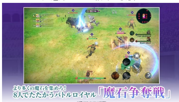
多人数でたたかうバトルロイヤル