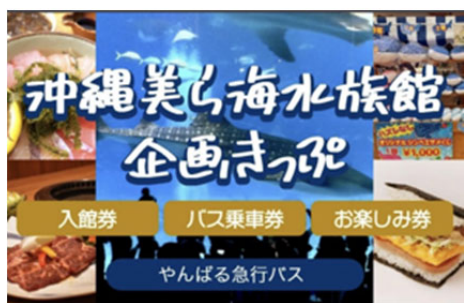
沖縄美ら海水族館企画きっぷ

沖縄美ら海水族館に来場するお客さまに本部町での滞在を楽しみ、回遊していただきたいという思いから生まれた今回の企画きっぷ。二次交通を活用することで渋滞の緩和をはかり、さらには脱二酸化炭素化で、沖縄の自然保護に貢献していきます。