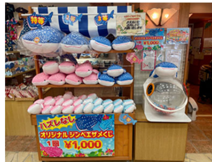
「ぬいぐるみくじ」(ハズレなし)