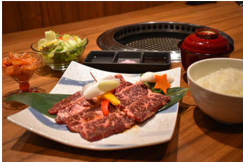
『BURIBUSHI』スペシャルランチ