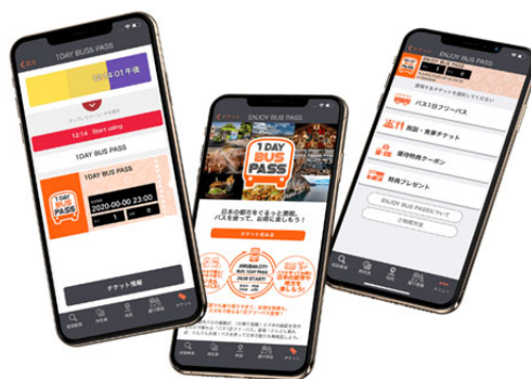
「乗換案内」アプリ内「ジョルダンモバイルチケット」