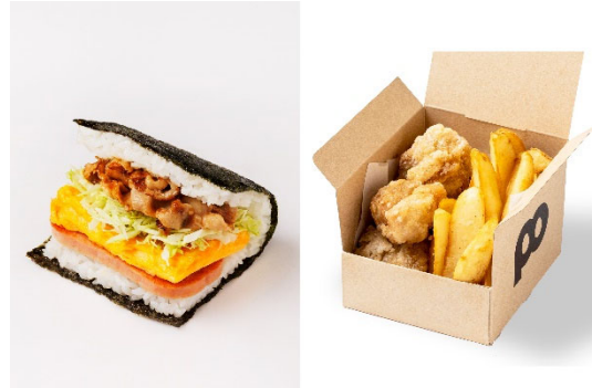
「本部産あぐー豚の生姜焼き」 + チキン唐揚げ&ポテトフライセット」