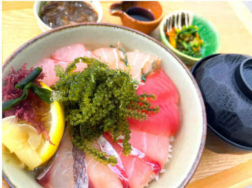
海邦丸 スペシャルメニュー「海ブドウ海鮮丼」