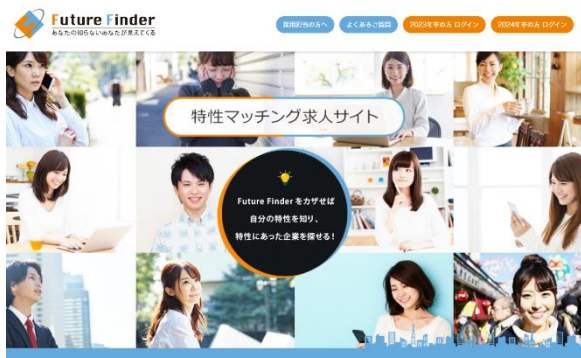
Future Finder ® の学生向けページ

Future Finder ® は、心理統計学を活用した診断エンジンを用いて、学生と企業との“特性マッチング”を行う就職支援（採用支援）サイトです。学生は、Future Finder ® 登録後に、任意で適性診断（特性診断）を受検します。企業も同様に、組織診断に回答し、自社での活躍人財モデル（自社で活躍している社員の特性を抽出した、採用ターゲット）を設定します。その結果を診断エンジンが分析し、マッチングさせることで、学生は自分の特性が活かせる社風の会社や仕事を見つけることができ、企業は自社で活躍する可能性の高い学生を探し出すことができるという仕組みです。企業は、求人サイト掲載とダイレトリクルーティングの2通りで学生にアプローチすることができます。