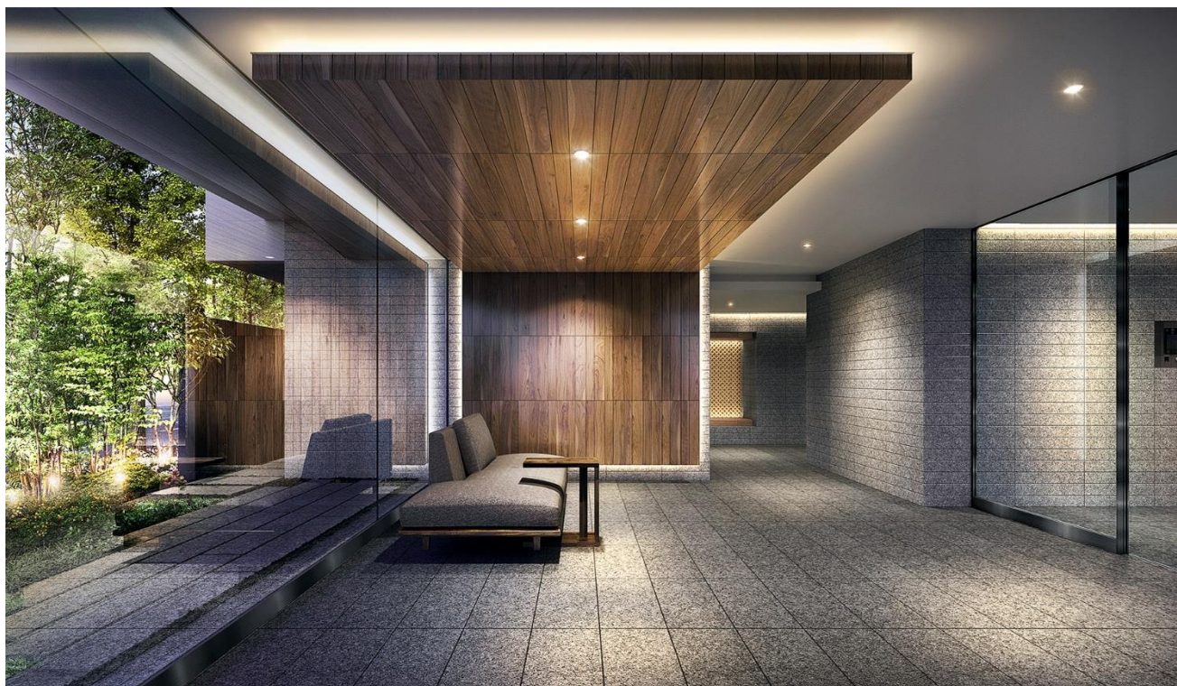
エントランスホール完成予想図(※1)