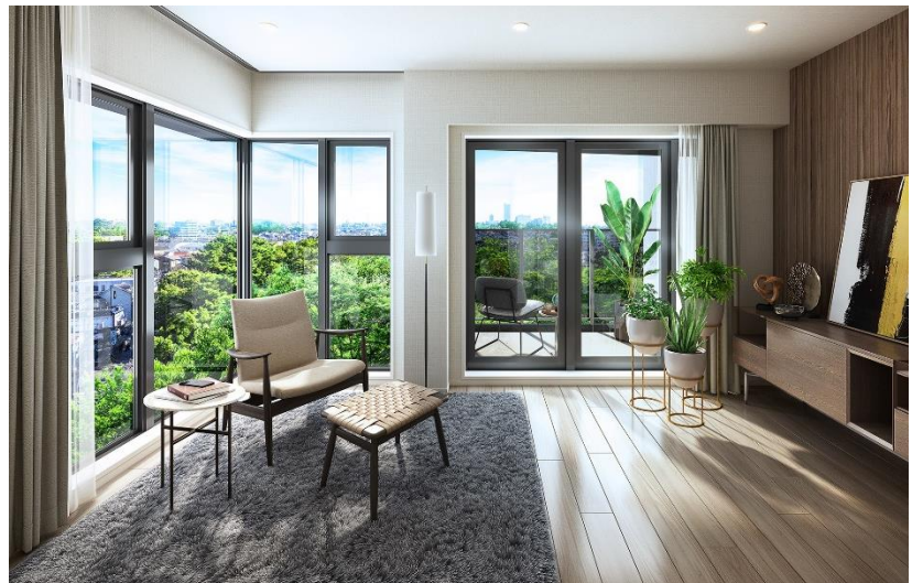
リビング・ダイニング完成予想図（Eタイプ）（※2）