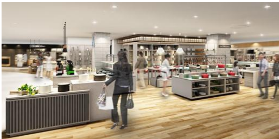
「グッドキッチンカンパニー」(イメージ)