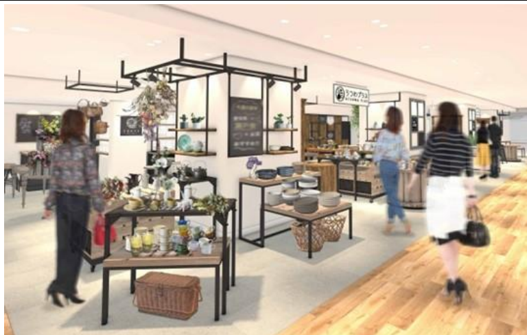
「うつわプラス」(イメージ)