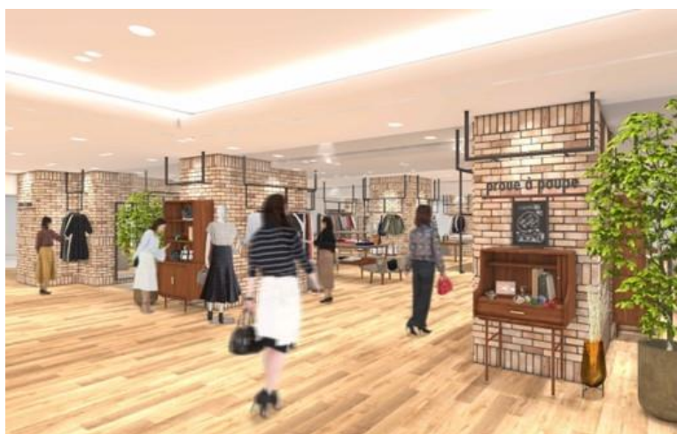
「プルアプープ」(イメージ)