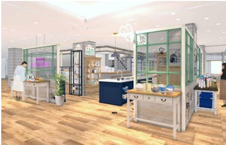
「ピーナッツ ライフ&タイムズ」(イメージ)