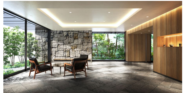
エントランスホール完成予想図