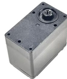
ニデックプレジジョン製 RC モジュール

パナソニックが発売したコミュニケーションロボット「NICOBO（ニコボ）」は「心の豊かさ」という価値提供を模索する同社の社員提案のプロジェクトから生まれた“弱いロボット”です。人の代わりに作業を行うロボットとは異なり、なにをするわけでもないニコボという存在が、周囲の人の優しさや笑顔を増幅し、今までにないロボットと人との幸せなかわり方を新たな価値として提案することを目指しています。