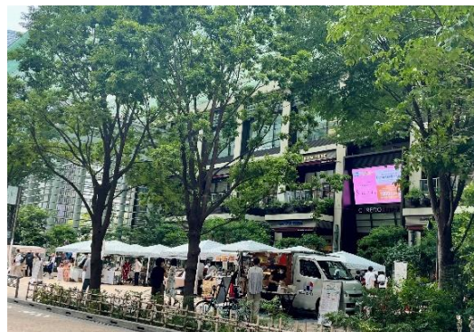
コレド室町テラスでのマルシェ実施イメージ