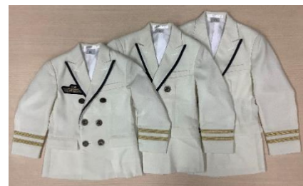
お子さま用駅長制服