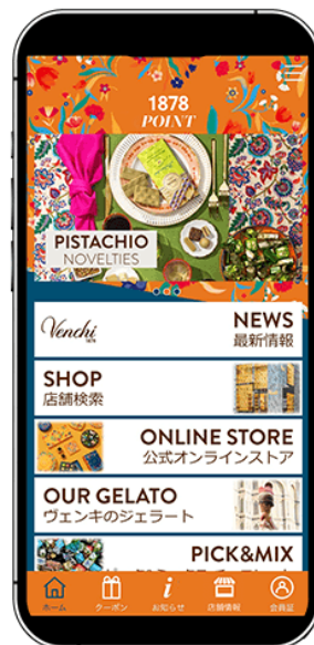
図1 『Venchi(ヴェンキ)公式アプリ』アイコンとトップ画面