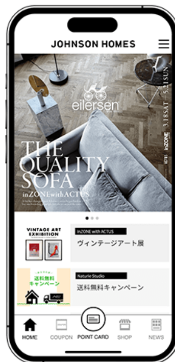
図1 『J POINT アプリ』アイコンとトップ画面