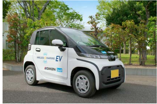
本実証で使用する車両

※参考 : トヨタ自動車株式会社ウェブサイト ( https://toyota.jp/cpod/index.html )