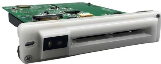
「アミューズメント設備向け多機能カードリーダ」

ニデック株式会社のグループ会社であるニデックインスツルメンツ株式会社（以下、当社）は多機能対応のカードリーダを開発いたしました。