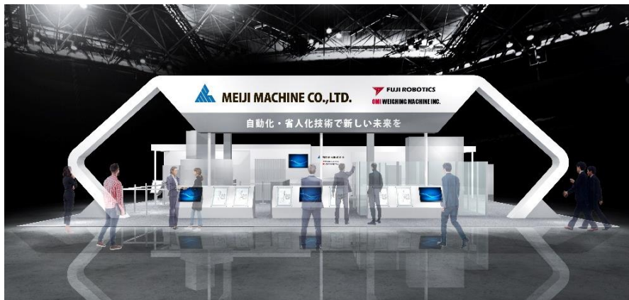
【明治機械ブースの配置】