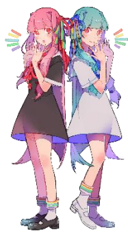
「琴葉 茜・葵」