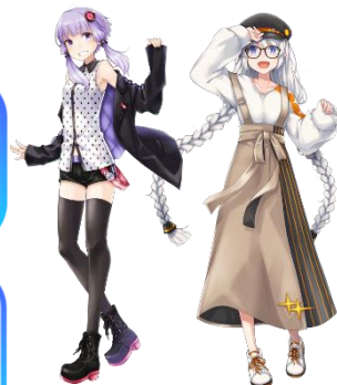
「結月ゆかり」「継星あかり」© VOCALOMAKETS Powered by Bumpy Factory Corp.

※ 現行のSeiren Voiceのライセンスは、コンプリートパックライセンスとして扱われます。