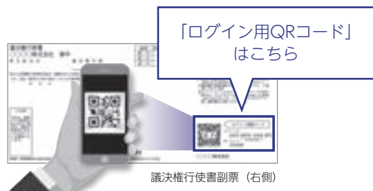
議決権行使書副票（右側）

同封の議決権行使書用紙に記載された「スマートフォン用議決権行使ウェブサイトログインQRコード」を読み取りいただくことにより、「ログインID」及び「パスワード」が入力不要でアクセスできます。