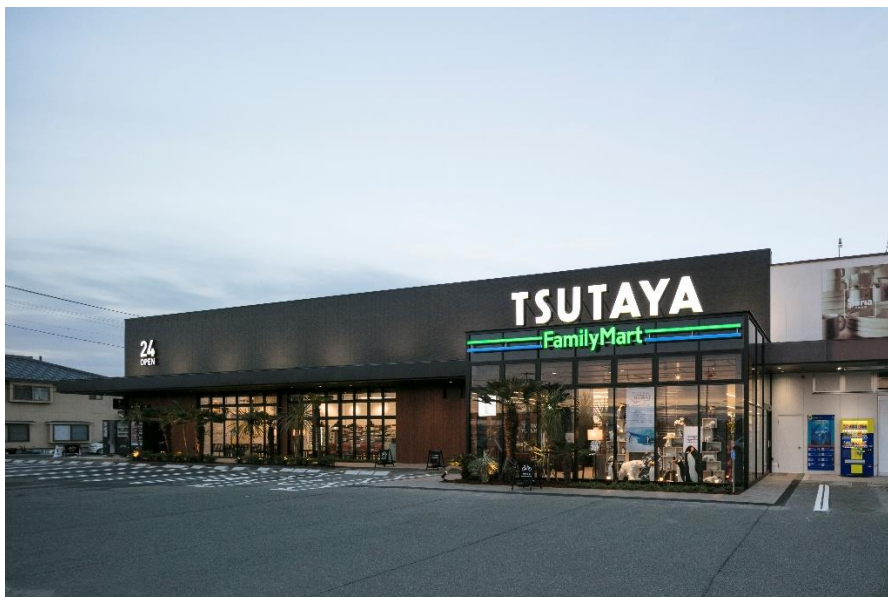
※『gashacoco TSUTAYA 松永店』外観