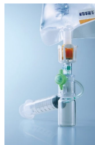
JMSの閉鎖式薬剤移注システム「ネオシールド」