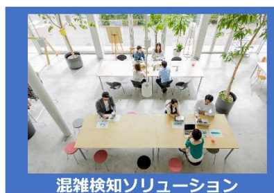
混雑検知ソリューション