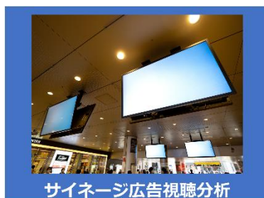
サイネージ広告視聴分析