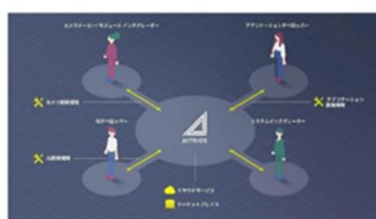
SSSのエッジAIセンシングプラットフォーム「AITRIOS™(アイトリオス)」