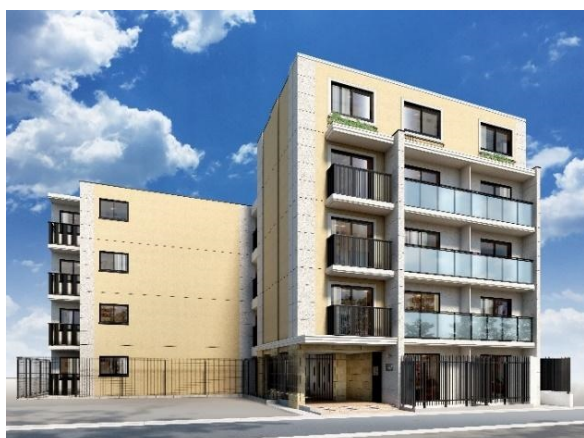
「EL FARO (エルファーロ)」シリーズ

当社が提供する新築 1 棟投資用賃貸マンション「EL FARO (エルファーロ)」、新築 1 棟投資用賃貸アパート「MIJAS (ミハス)」は地盤が強く、資産価値の下がりにくい城南・城西地区を中心に展開しております。両シリーズとも平均稼働率約 96% (2023 年 4 月時点)、優れた立地条件と魅力的なデザイン、上質な設備・仕様で高稼働・長期間稼働を実現すると共に、資産防衛、相続税対策に有効な安定的投資用商品としてお客様にご支持をいただいております。