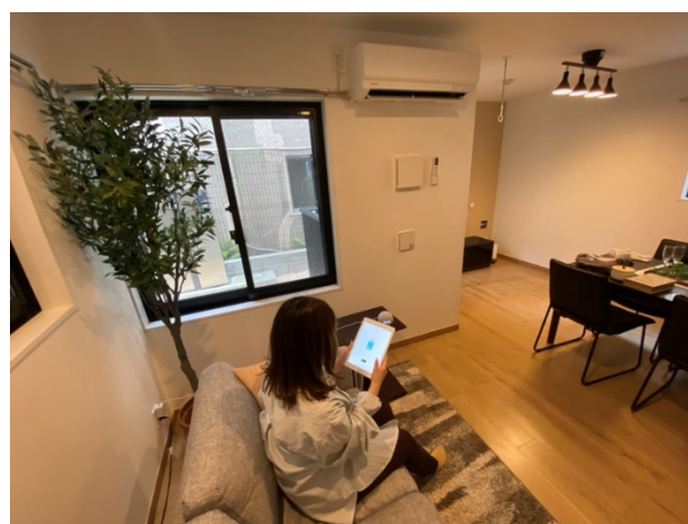
「パッとスマート」設定風景イメージ