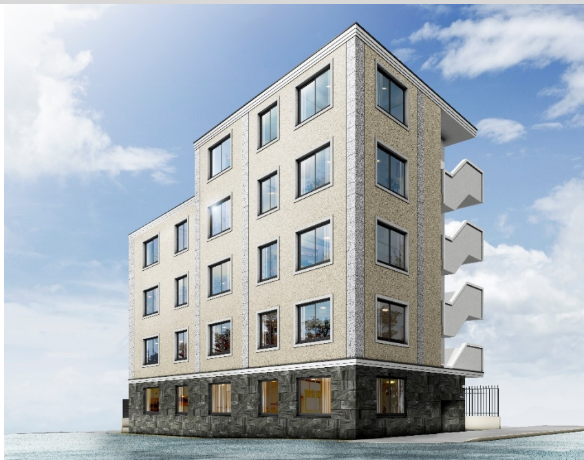
EL FARO 大塚 イメージ図