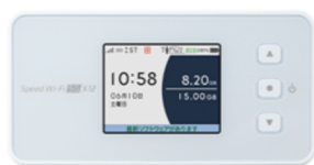
<Speed Wi-Fi 5G X12>