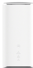
<Speed Wi-Fi HOME 5G L13>