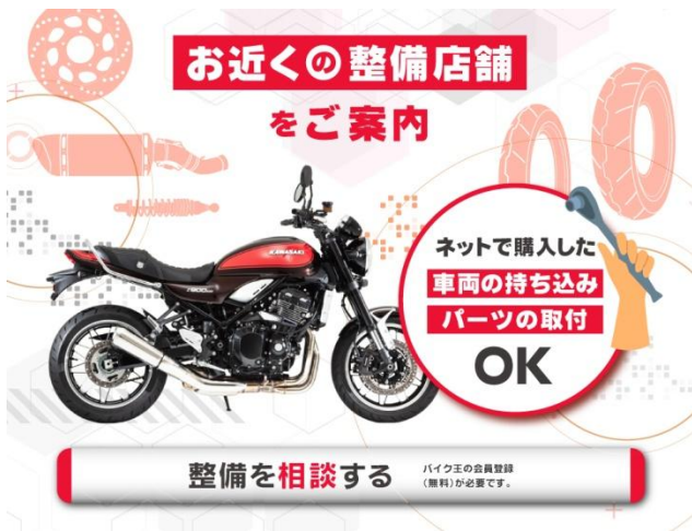
公式 HP イメージ