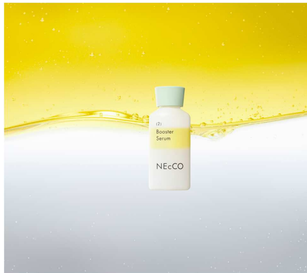
「NEcCO ブースターセラム」商品イメージ

「NEcCO ブースターセラム」は、2023年6月1日より公式通販サイトであるユーグレナ・オンライン（ https://online.euglena.jp ）にて販売します。今後も順次ラインアップを拡充していく予定です。