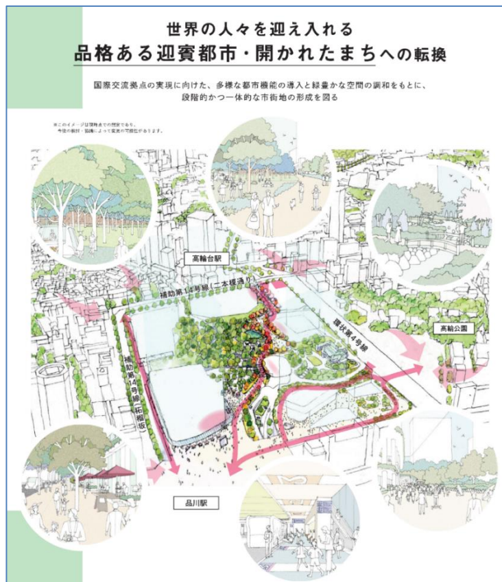
(品川駅西口地区まちづくり指針 (高輪三丁目地区) より抜粋)