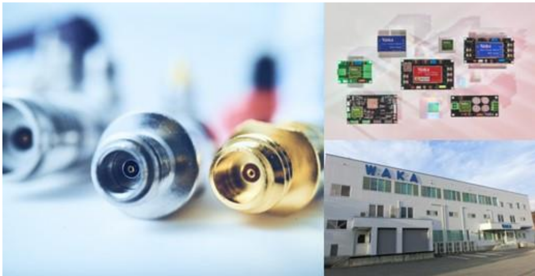
高度な社会が要求する「高精度」を実現する電子部品メーカーです。

なお、ワカ製作所の上場詳細は、下記サイトをご参照ください。 (東京証券取引所: https://www.jpx.co.jp/equities/products/tpm/issues/index.html ) (ワカ製作所: https://www.waka.co.jp/ )