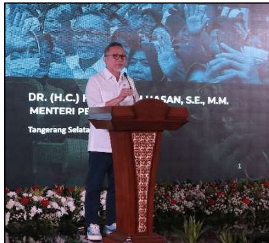
祝辞を述べる Zulkifli 貿易省大臣