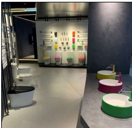
サプライヤーブースコンペティションでイノベティブブース賞を受賞した、Germany Brilliant 社のブース