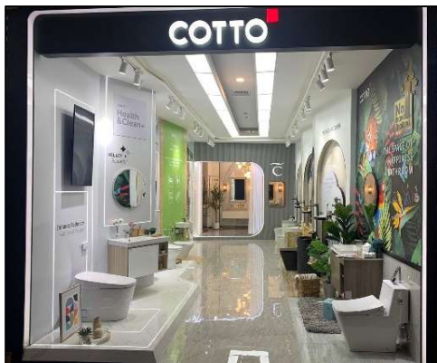
サプライヤーブースコンペティションで大賞を受賞した、COTTO 社のブース