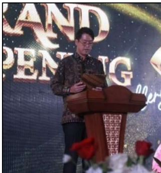
店舗オープンへの意気込みを語る垂井社長