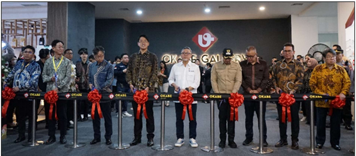
関係者によるテープカットの様子

そして、オープニングセレモニー後は、お客様を店内にお迎えのうえ、店舗案内ツアーなどのイベントも実施し、盛況のうちにオープン初日を終わりました。