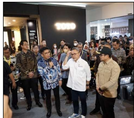
店舗内ギャラリーを視察する Zulkifli 貿易省大臣と説明を行う Budi 副社長