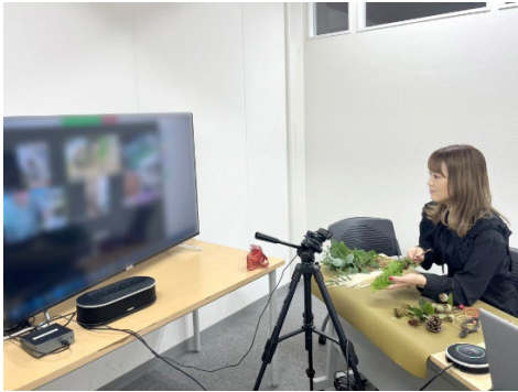
Zoom を使ったオンラインレッスン

100 株以上でオンラインのフラワーレッスンにお申し込みいただけます。今回新たにお子様を対象としたレッスンを追加いたします。抽選でご招待いたします。