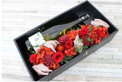
ブリザーブドフラワー