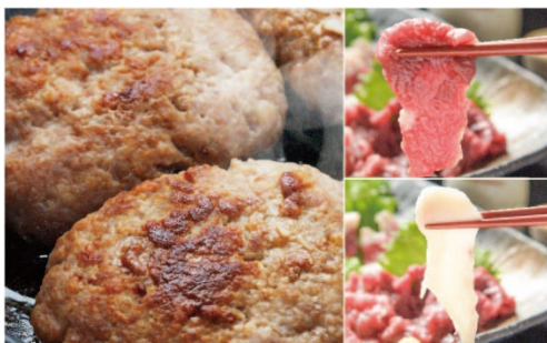
5,500 円（送料込）相当 あか牛ハンバーグ+馬刺しセット （熊本県産あか牛ハンバーグ5ヶ、国産熊本肥育上赤身刺し 100g、国産コーネ馬刺し 50g+馬刺しのたれ付き）