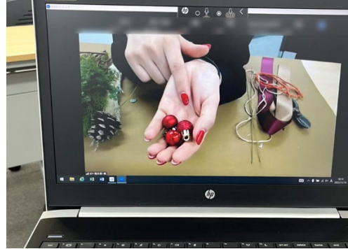
少人数でアットホームな雰囲気のレッスンです