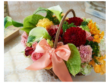
生花アレンジメント