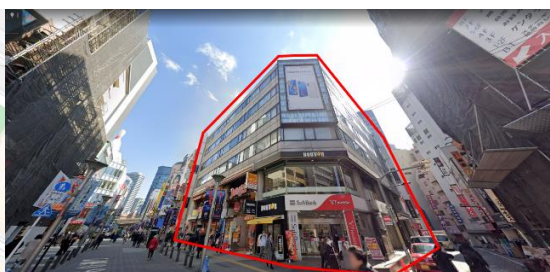
旧建物（イケブクロ・ロクマルビル）