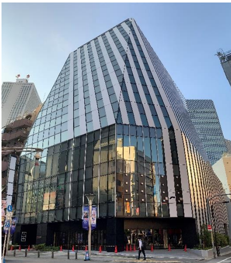
現地写真（2023年6月1日時点）

本物件は地下2階地上11階建ての施設で、アミューズメント施設やクリニックなどが出店予定の複合施設です。低層・高層部がモノリシックな一体構成になっていることで角度によって見え方が変わる印象的なデザインの建物で、地域のシンボルになることが期待されています。歩行者通行量の多いサンシャイン60通りに対しては、開放的で明るいエントランスアプローチとし、周辺への圧迫感を減らすデザインとしています。