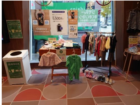
「すくすくボタン」の様子（ドコモショップ札幌店）