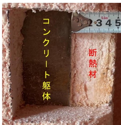
断熱材施工具体例