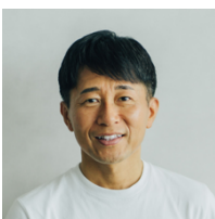
守屋 実 氏 新規事業家

スタートアップ都市推進協議会会長、Mayors 連合(令和臨調「市区町村長連合」)代表、政府のデジタル臨時行政調査会や行政改革推進会議の構成員を務める。