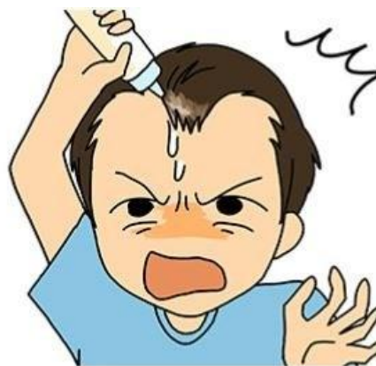
たら〜っと垂れてきて 顔中ベタベタ