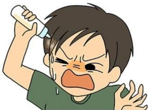
ボタボタ水たまり状態

149名が不便・不快なところがあると回答し、その内62名が液だれ・べたつきと回答。