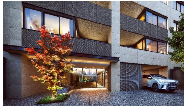
エントランスアプローチ完成予想図（※2）