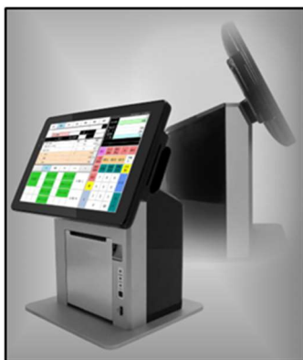
エントリーモデル