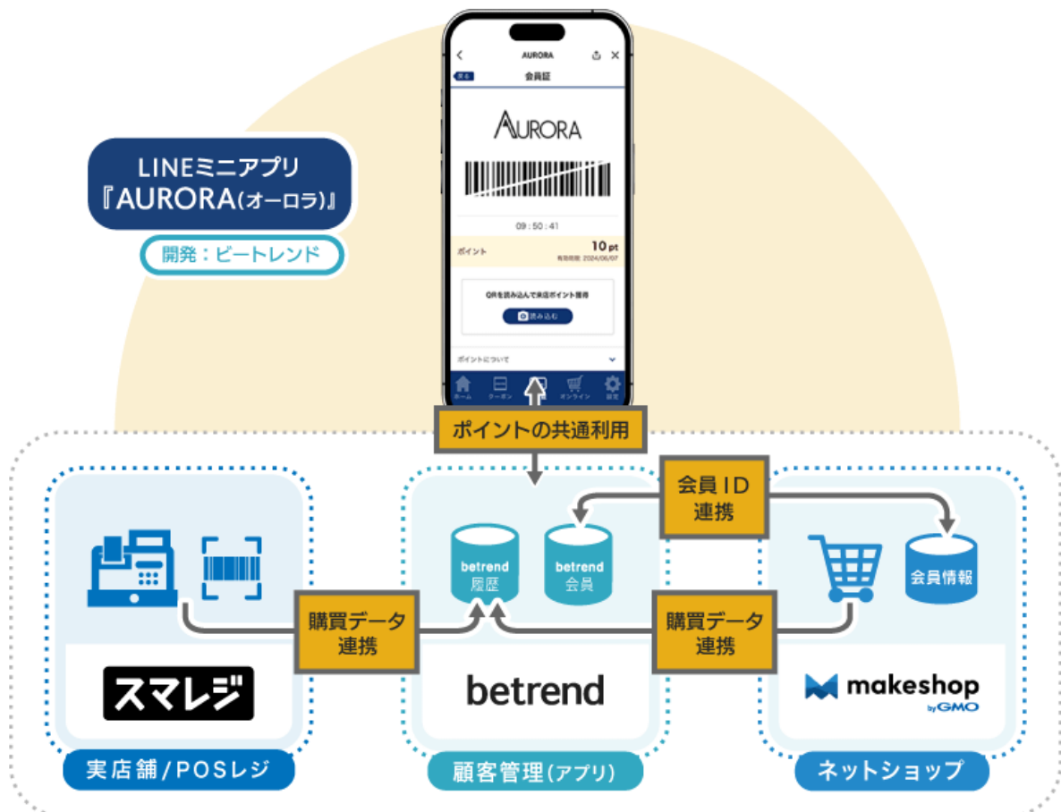
図2 『スマレジ』・『makeshop byGMO』との連携イメージ

店舗のPOSレジは、株式会社スマレジが提供するクラウド POS レジ『スマレジ』、公式ネットショップには、GMO メイクショップ株式会社が提供する EC サイト構築 SaaS『makeshop byGMO』を採用しています。POS レジとネットショップの双方と『betrend』がシステム連携しており、店舗とネットショップの会員情報連携をすることでポイント/購買情報を統合管理できます。ポイント・購買データを販促施策に活用することで、きめ細やかな CRM を実現できます。オーロラでは、従来ネットショップ等への出店を中心に行ってきたため、直営店の店舗数増加に伴い、会員の購買行動の可視化・分析などへの活用が期待されています。