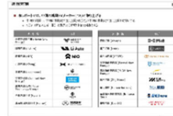
中国・新興EVメーカー調査