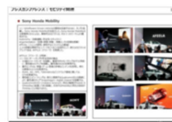
CES2023 モビリティ関連調査