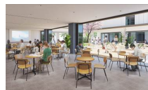
【1階】扉を開放することで中庭と一体となる多目的室

本事業は、東京海洋大学が大和ハウス工業を代表とする、現代建築研究所、大和ライフネクスト、芙蓉総合リースで構成されるグループと連携し、海洋分野における産官学リーダーを育成する国際混住寮を整備することで、国際的な教育・研究環境の向上を目指す事業です。