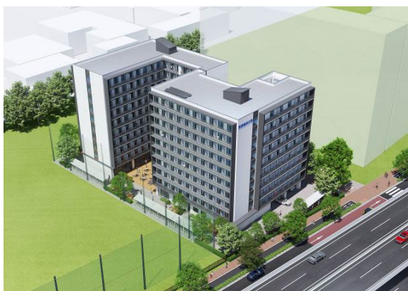
【完成予想図】上空から見た混住寮

本事業におけるBTO（Build Transfer Operate）方式とは、民間事業者が大学施設の建設を行い、完成後に施設の所有権を大学に移転し、民間事業者が施設の管理・運営を行う事業方式のこと。