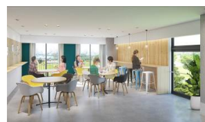
【2階～10階】南側の窓から運河などを望めるビューラウンジ