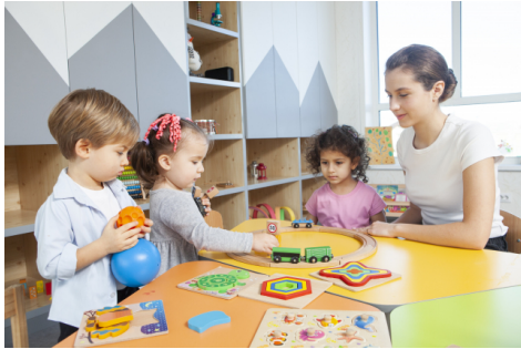
【「プレイルーム」(イメージ)】 10階 「ファミリーフロア」内 子供の遊び場スペース

混住寮は、2棟（東棟・西棟）からなり、地上10階建て、総戸数約350戸を予定しています。2階から9階までを寮生のフロアとし、9階の一部には防音扉で分けられた研究者対象の住戸を用意します。また、10階は外国人研究者等の家族での居住を想定した「ファミリーフロア」とし、子どもが遊べるスペースとして「プレイルーム」を設置。各階の中央部には、交流スペースを設け、居住者同士のコミュニケーションの醸成を支援します。