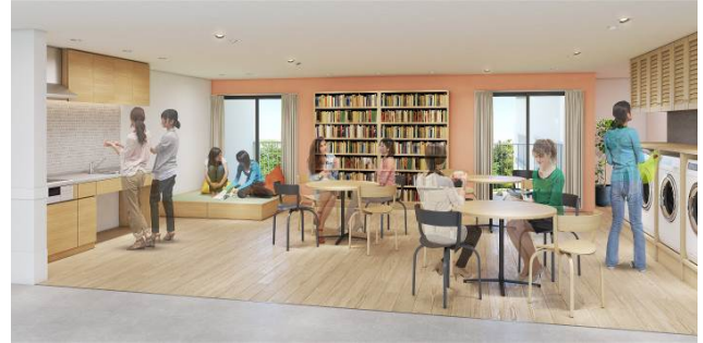
【交流スペース】 2～10階 寮生が歓談する様子