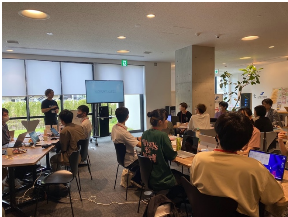
6月25日開催の プレイベントの様子