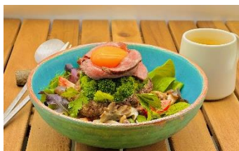
ミューの森ライスディッシュ ローストビーフとハンバーグ