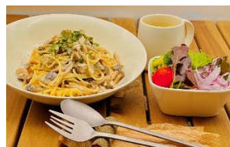
森の恵み クリームパスタ