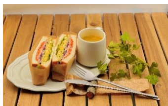
卵とツナ お野菜たっぷり サンドイッチ