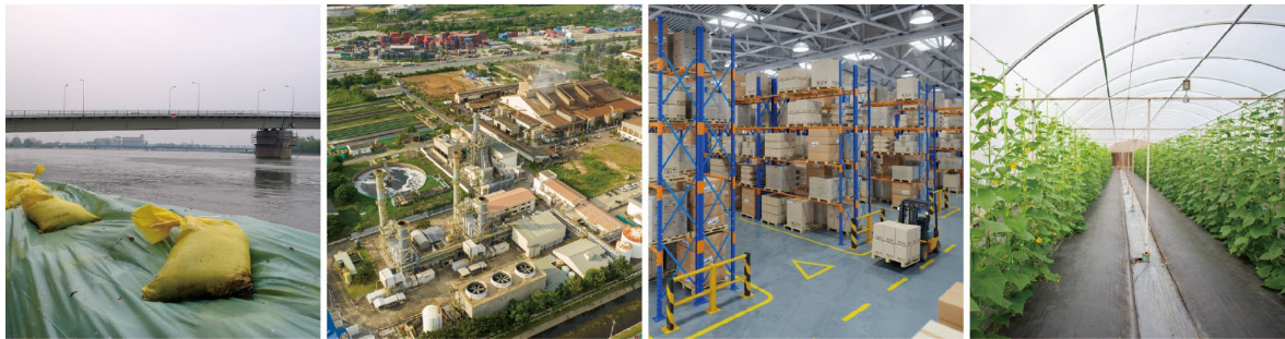
（左から）河川の遠隔監視、建設現場の遠隔監視、広域敷地内監視、農作物の遠隔監視のイメージ