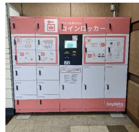
<10カ所17拠点に展開しているBOPISTA>