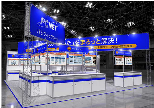
ブースイメージ図 小間番号:2-32(右図レイアウト参照)

URL: https://www.japan-it.jp/nagoya/ja-jp.html