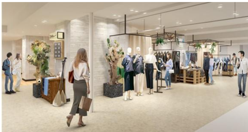
「デニムセレクト」(イメージ)