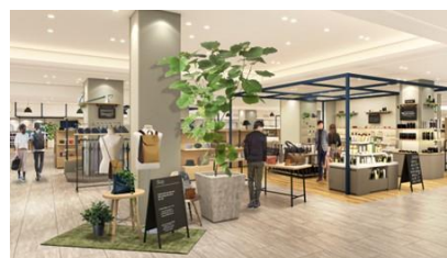
「メンズビューティー」(イメージ)