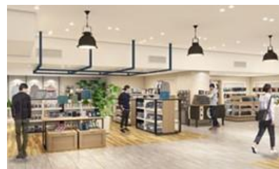
「洋品雑貨」(イメージ)

ビジネストラベル:「TUMI」「サムソナイト」「エース」「チャーリーブレイバー」