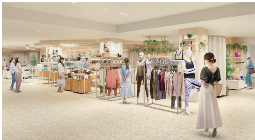
「モーニングフロー」(イメージ)