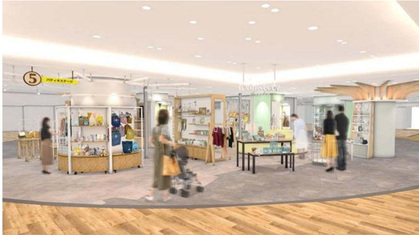
「ママ＆ベビーセレクト」(イメージ)

子育てゾーンは、本館5階「Affection for Life ～優しさあふれるファミリーの暮らし～」の象徴とも言える売場です。本館8階からの移設にあたり売場を再編成し、7つのブランドを新規導入し、6つのブランドを移設リニューアルします。ワールドの中心にある「ママ＆ベビーセレクト」は、自分らしい子育てライフを楽しみたいママ・パパに向けて、育児雑貨やベビーギフトをはじめ、「育」をテーマにした絵本や食など、トータルに提案する自主編集売場です。