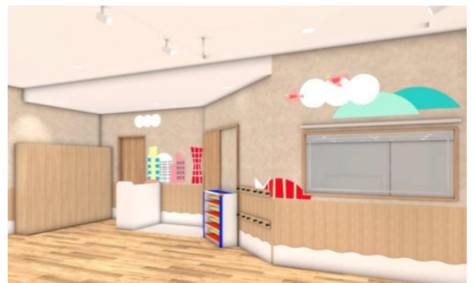
「コミュニティースクエア」(イメージ)