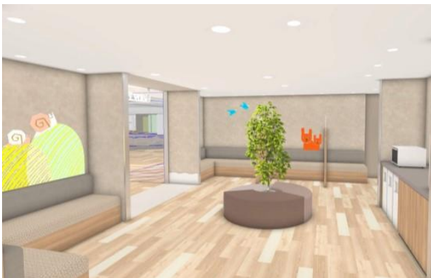
「ベビールーム」(イメージ)

ベビールームとコミュニティースクエアの壁面デザインは、「ポーネルンド」が監修しました。