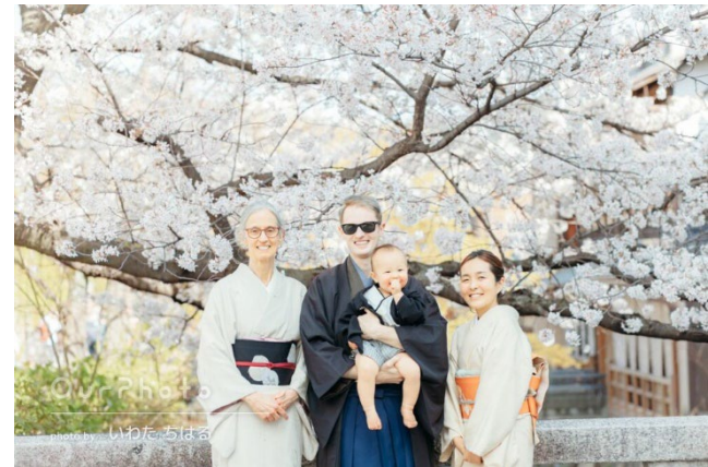
▲ 「OurPhoto」で撮影された写真の一例

「OurPhoto」は、「WAmazing Play」での新たな取り組みを通じて、より多くの訪日外国人旅行者に日本独自の文化や美しい景色を体験していただき、その素敵な思い出を写真として残していただきたいと考えております。さらに、その思い出が体験談とともにSNSなどを通じて世界に発信され、日本の魅力が世界中の人々に伝わることを期待しております。