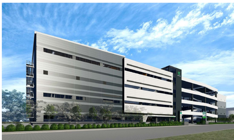
GLP ALFALINK 流山 4