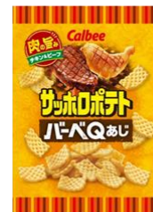
サッポロポテト バーベQあじ