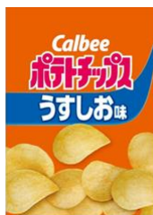
ポテトチップス うすしお味