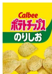
ポテトチップス のりしお