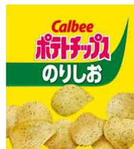
ポテトチップス のりしお