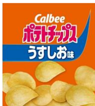
ポテトチップス うすしお味