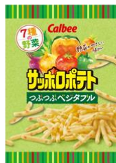
サッポロポテト つぶつぶベジタブル